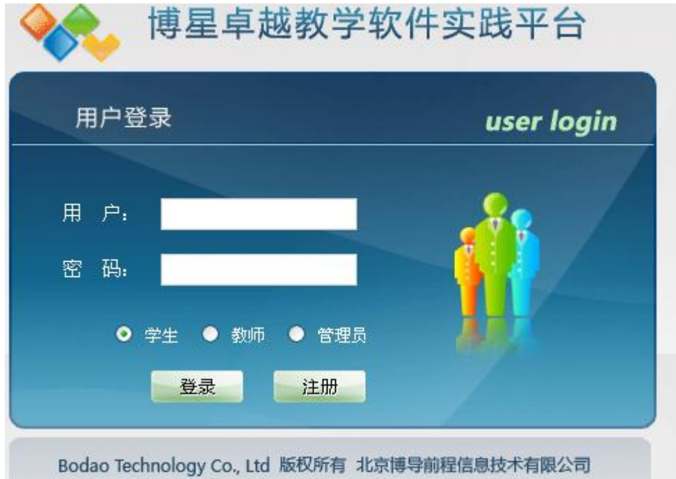
管理员端登陆页面