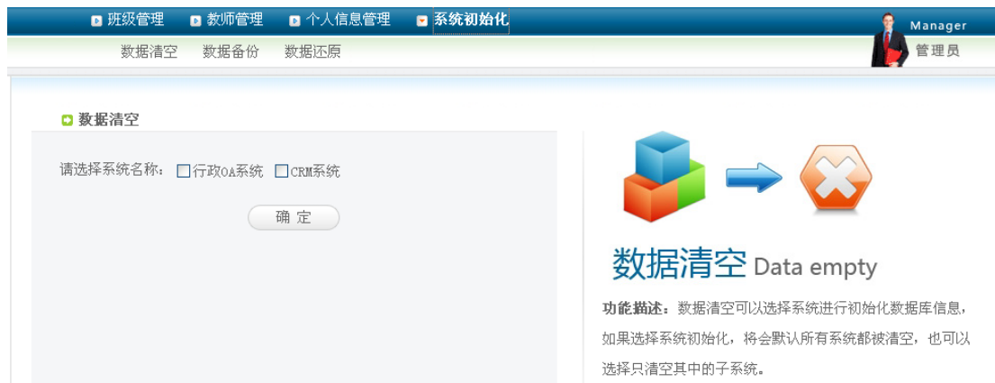
系统初始化管理页面