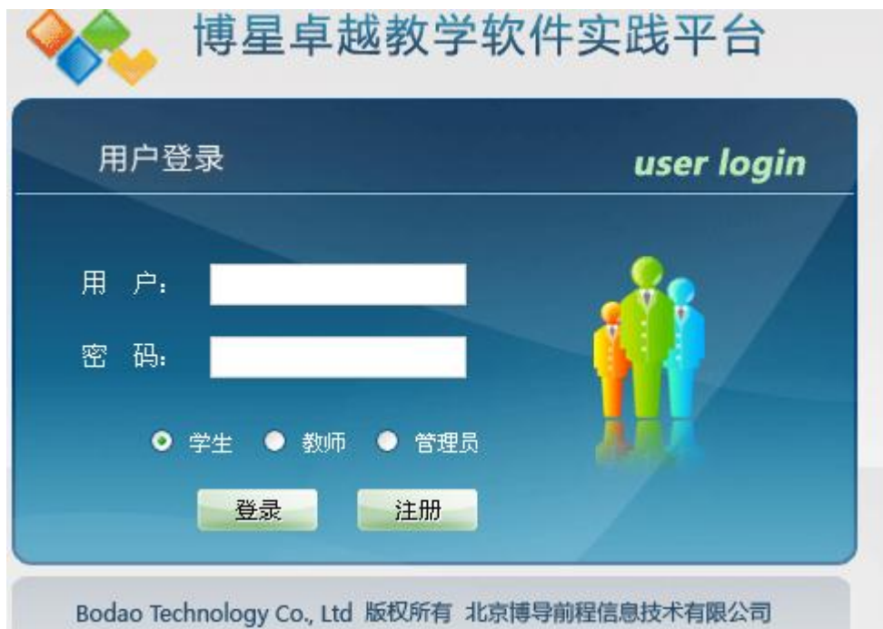
管理员端登陆页面