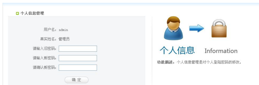
个人信息管理页面