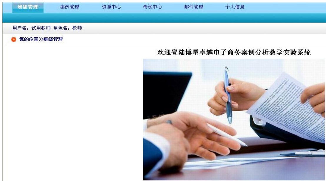
行业案例分析主页面