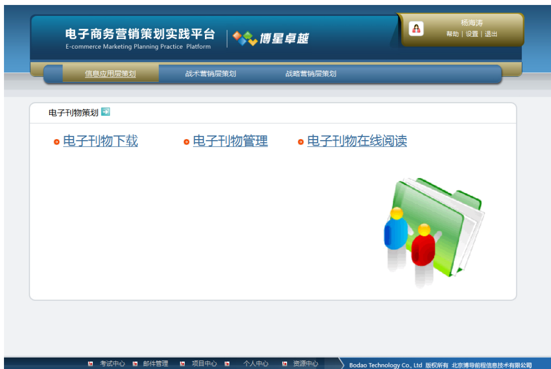
电子刊物策划页面

点击“电子刊物策划”，可以进行电子刊物营销策划，包括：“电子刊物下载”、“电子刊物管理”和“电子刊物在线阅读”。如下图：