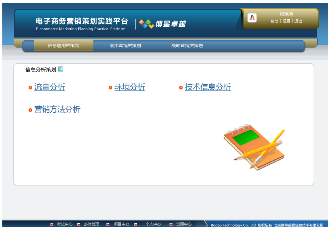
信息分析策划页面