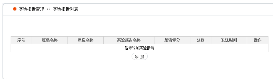
实验报告管理页面