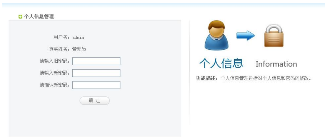
个人信息修改页面