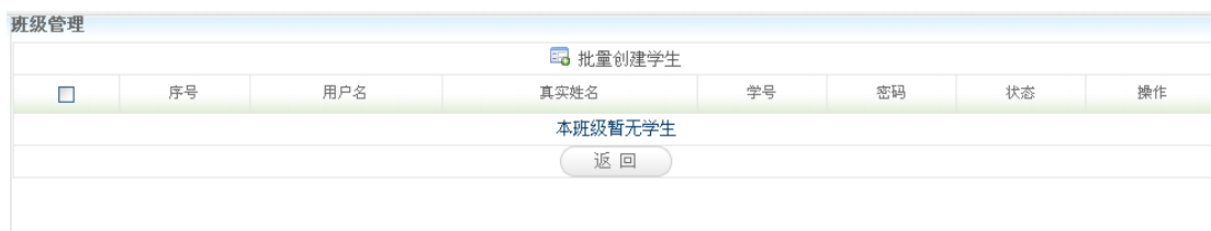
批量创建学生页面

3) 点击“确定”按钮后，新建班级成功。点击新建班级的“查看”按钮，系统会跳转到查看页面，如下图所示：