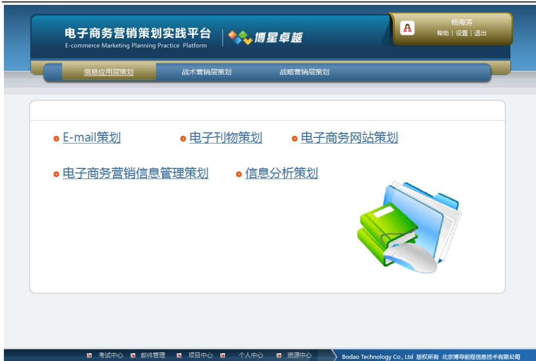
信息应用层策划页面

点击“E-mail 策划”，可以进行 E-mail 营销策划页面，包括：“E-mail 管理”和“E-mail 推广”。如下图：